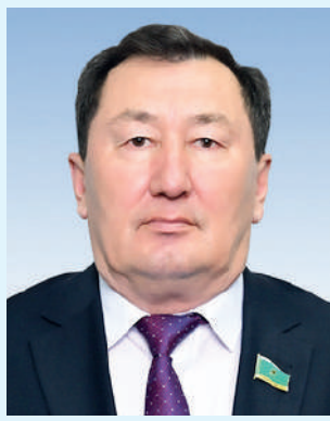
Наурызбай БАЙҚАДАМОВ, Сенат депутаты: